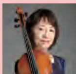
阿部真弓（ヴァイオリン）